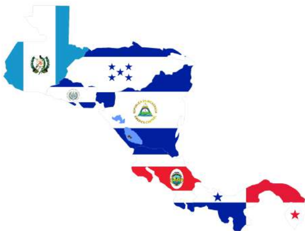
Países miembro de la COCATRAM y REPICA

No es un documento rígido, sino flexible y abierto que puede y debe ser modificado, implementado y completado según evolucionen las legislaciones ambientales y las prácticas del trabajo portuario, el comercio internacional y surjan nuevos aspectos ambientales y tecnologías que requieran ser atendidos, el Código forma parte de un proceso a largo plazo para mejorar los niveles de manejo ambiental en los puertos, a través del progresivo mejoramiento del trabajo portuario con relación al medio ambiente. El Código reconoce las oportunidades que ofrece la promoción del medio marítimo de transporte, incluido el cabotaje regional, a través de un trabajo portuario amigable con el ambiente.